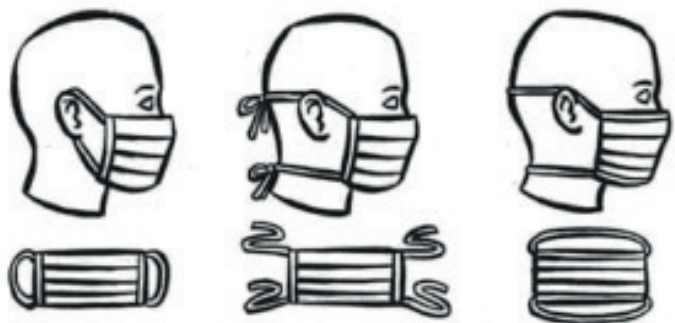
RŮZNÉ TYPY ÚVAZŮ